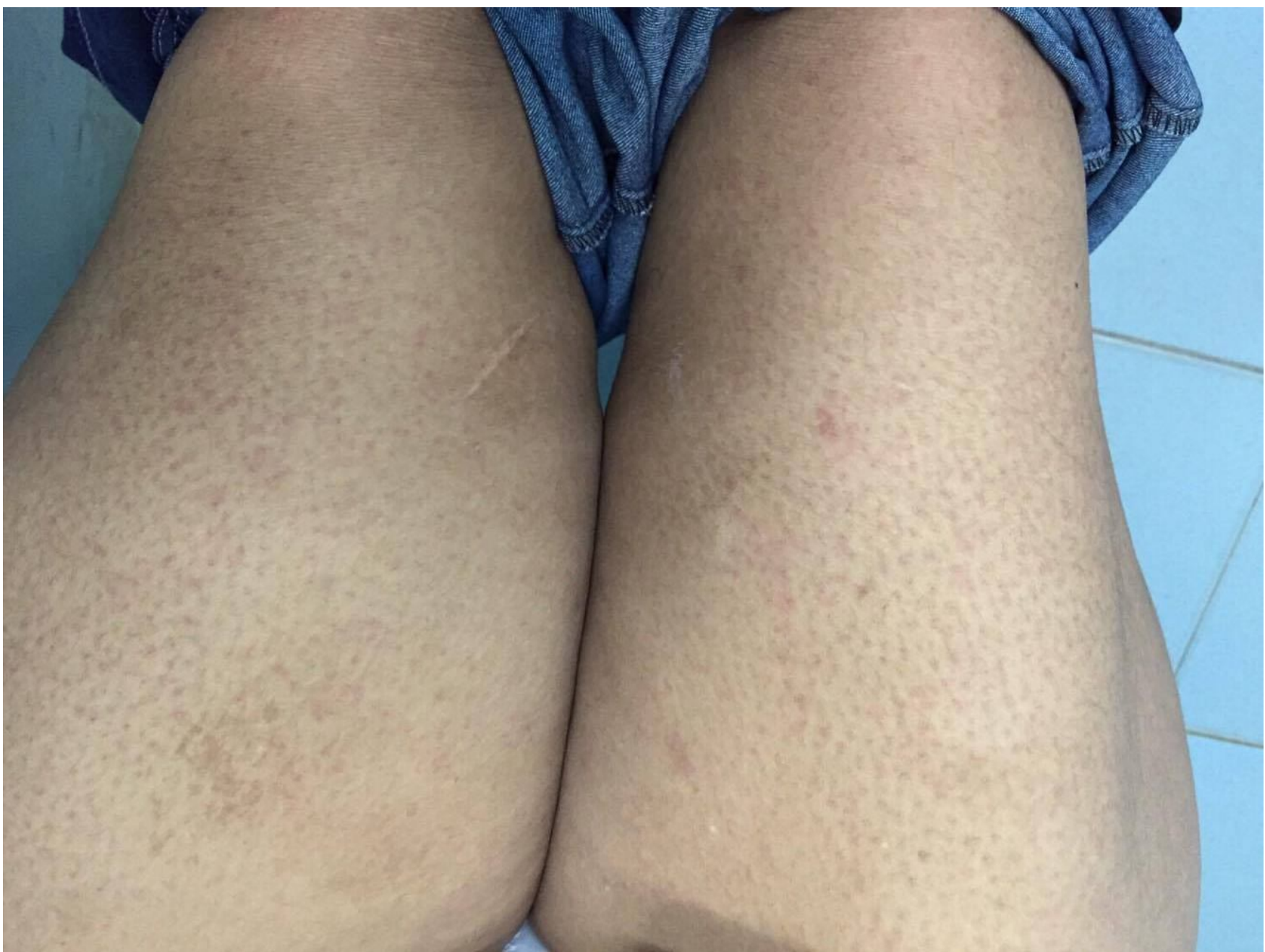
Maculopapular rash from ampicillin