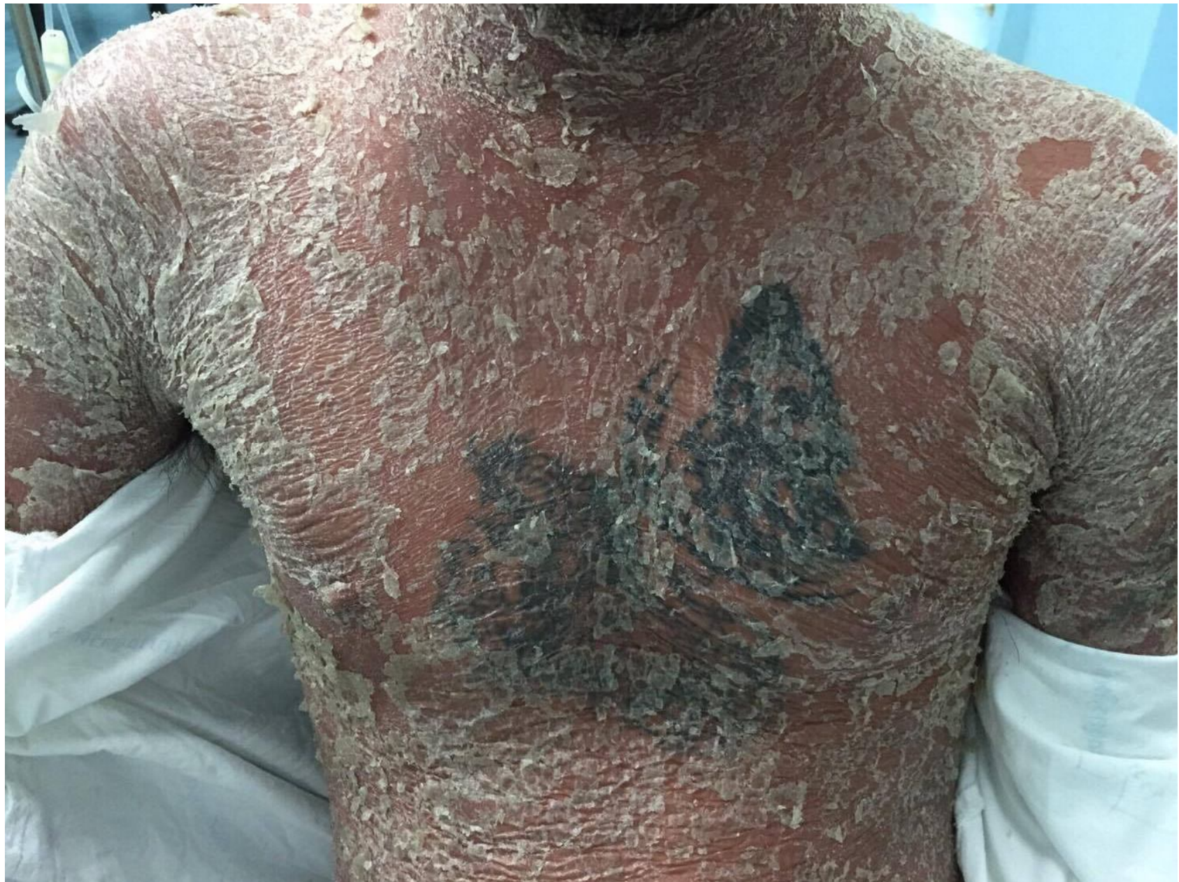
Exfoliative Dermatitis from Herb