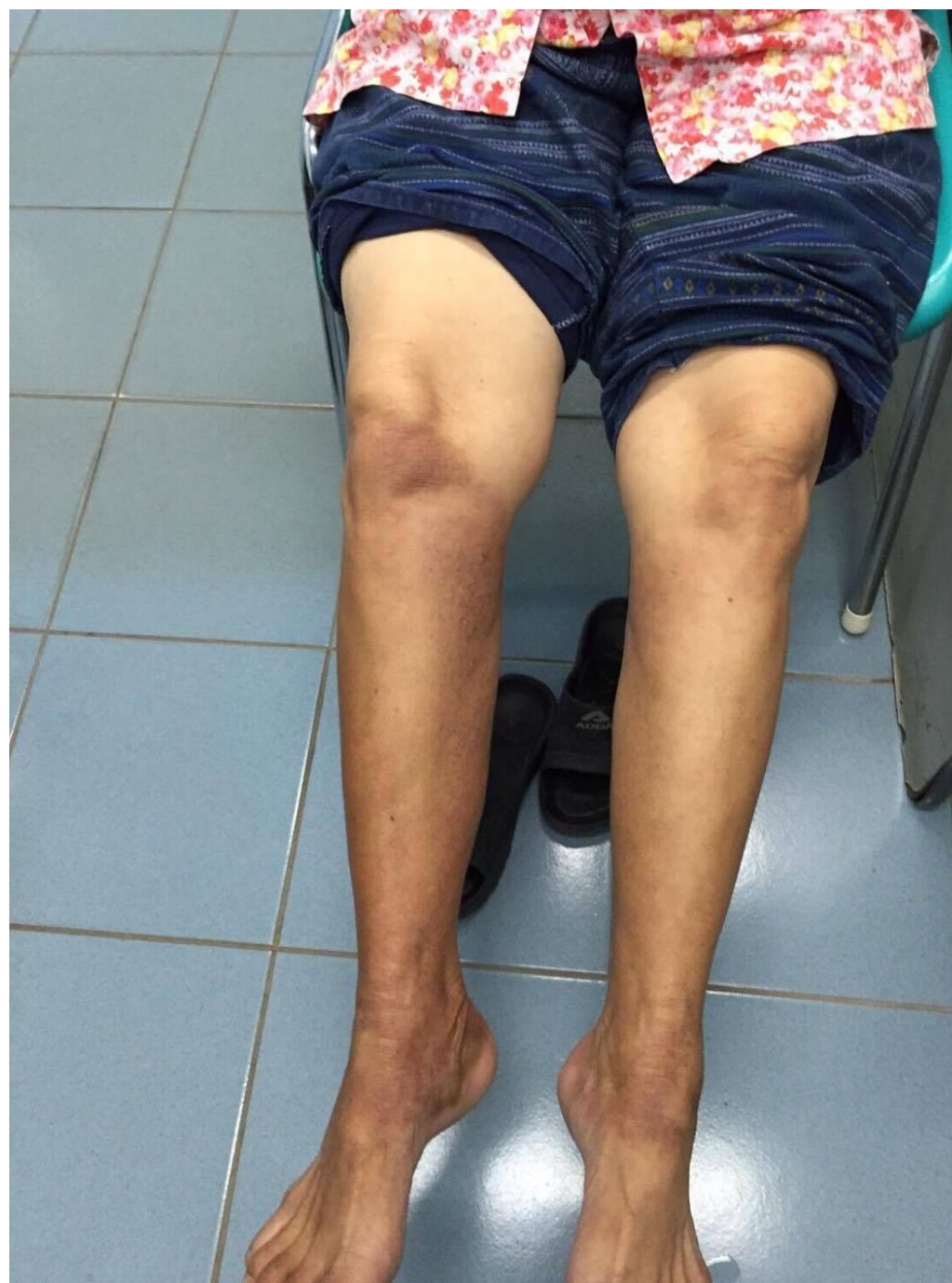
Drug induced photodermatitis